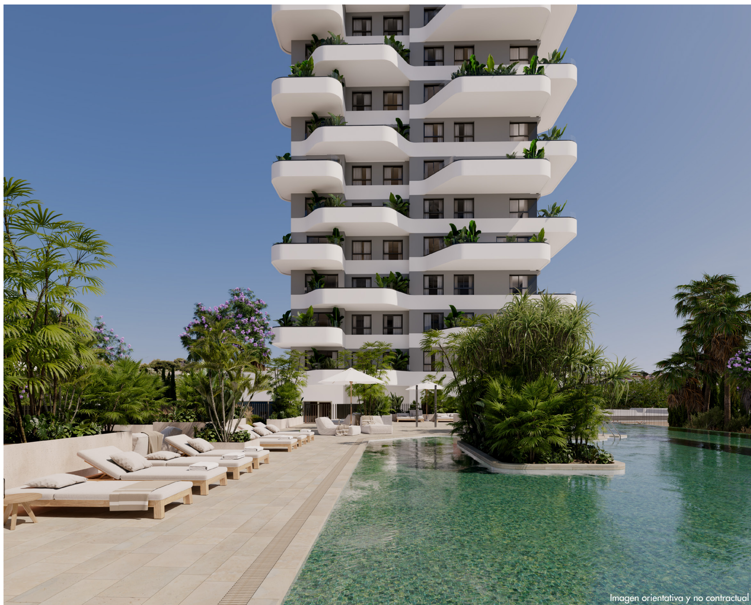
Imagen orientativa y no contractual