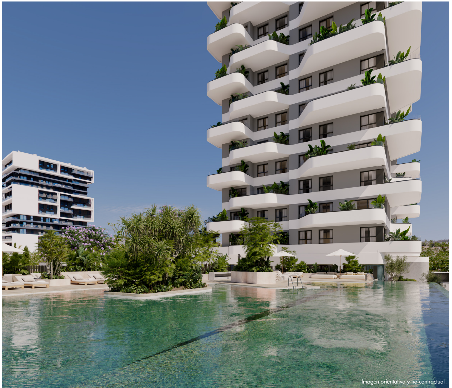
Imagen orientativa y no contractual

Salinas Towers se proyecta como un complejo residencial de viviendas colectivas en el ámbito de El Saladar, a 3 minutos de la playa, cerca del centro urbano y junto a las Salinas de Calpe, preciada lámina de agua, hábitat de numerosas especies animales, especialmente aves. En el entorno del Parque Natural del Peñón de Ifach.