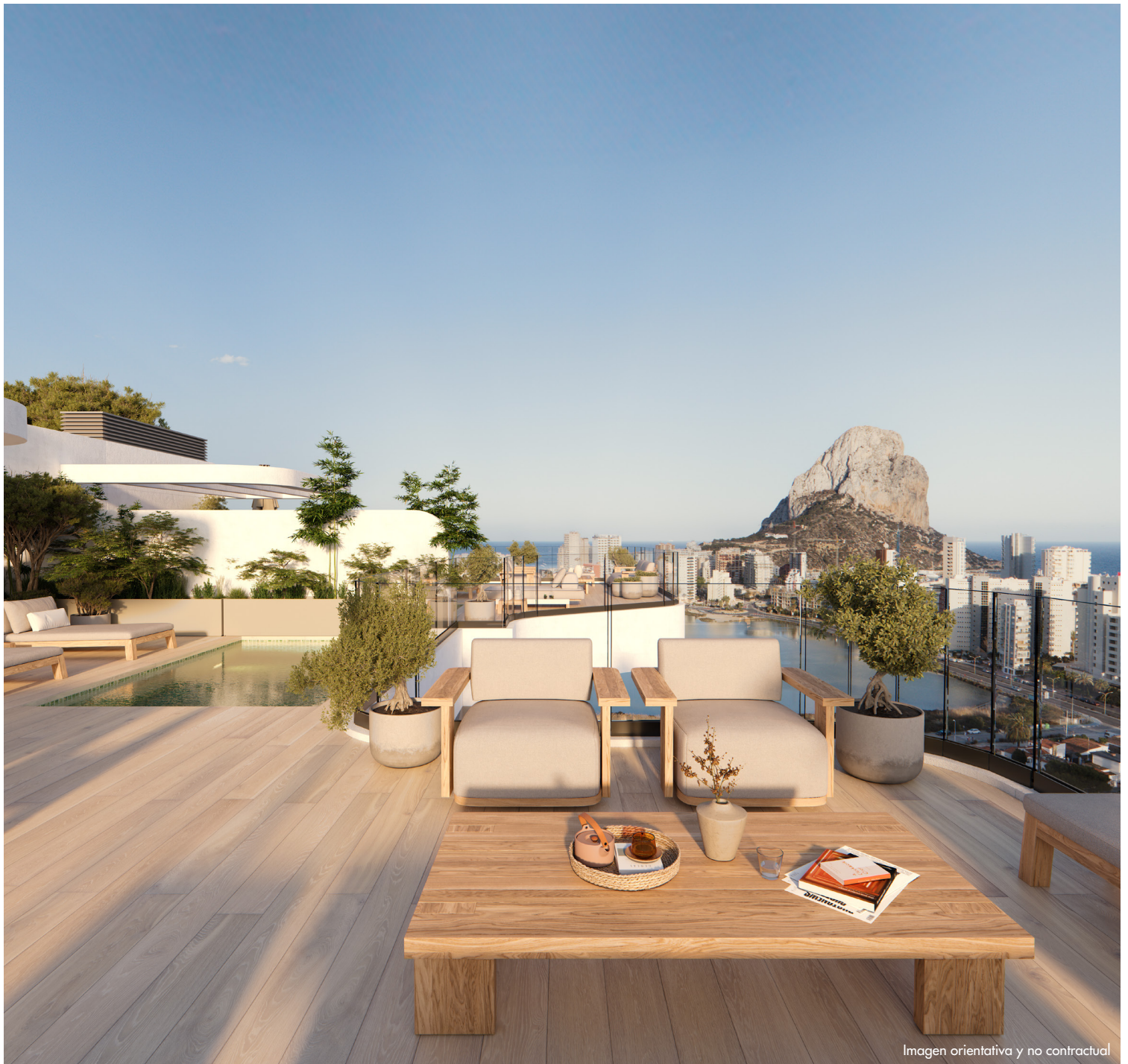
Imagen orientativa y no contractual