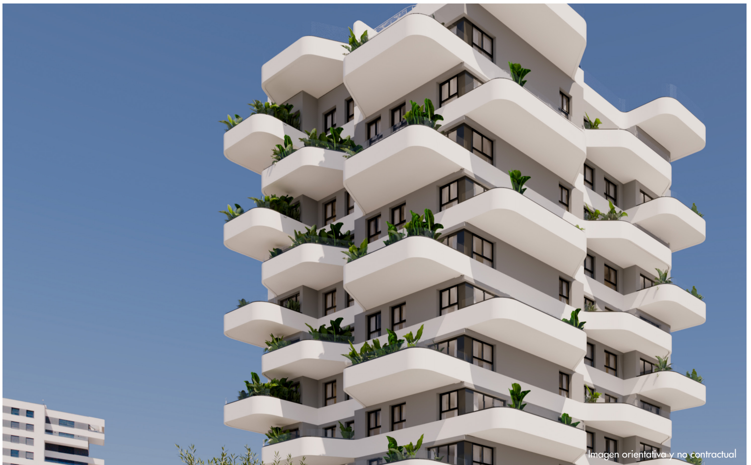
Imagen orientativa y no contractual